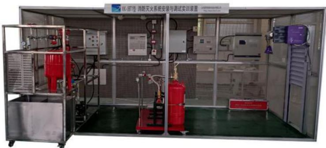
图 3 XK-JBT1 型消防灭火系统安装与调试实训装置

7. 竞赛场地实现对外开放和观摩，在赛场内设置参观区域，允许观众和指导教师在规定时间内现场观摩大赛。